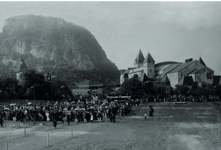
Die Festspielhalle auf der Schanz, erbaut 1906

Das Jubiläum feiert die Stadt mit einer Doppelausstellung - einer historischen und einer Foto-Ausstellung.