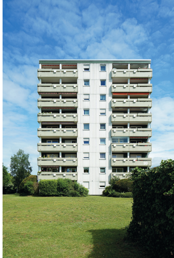
Marcus Schwier: Hochhaus in Singen, 2020 MAGGI-Werk Singen / Nestlé Deutschland AG, 2022

Marcus Schwier: Takeda Pharma, Produktionsstätte Singen, 2023